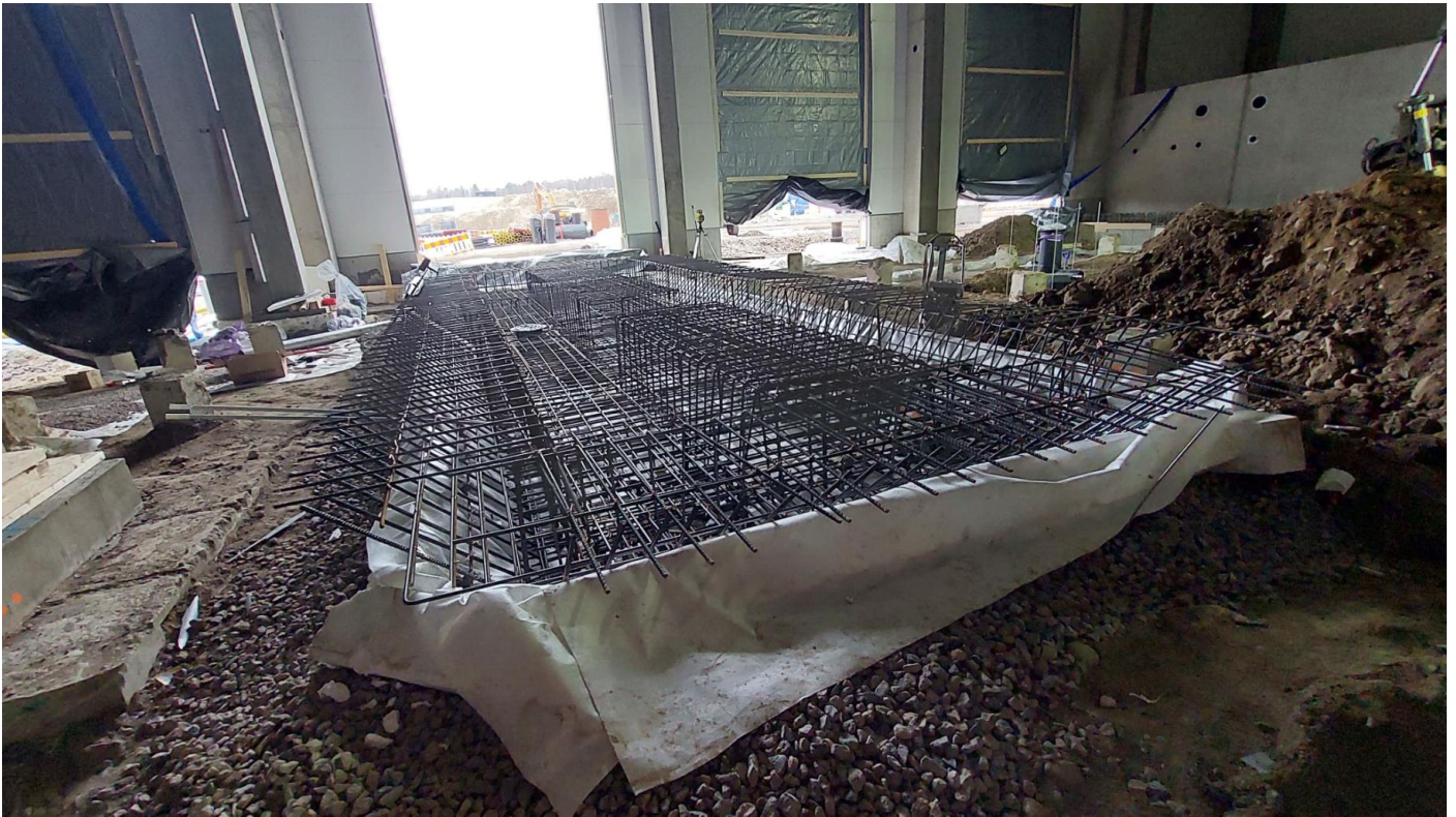
D-Lohko - huoltotilat