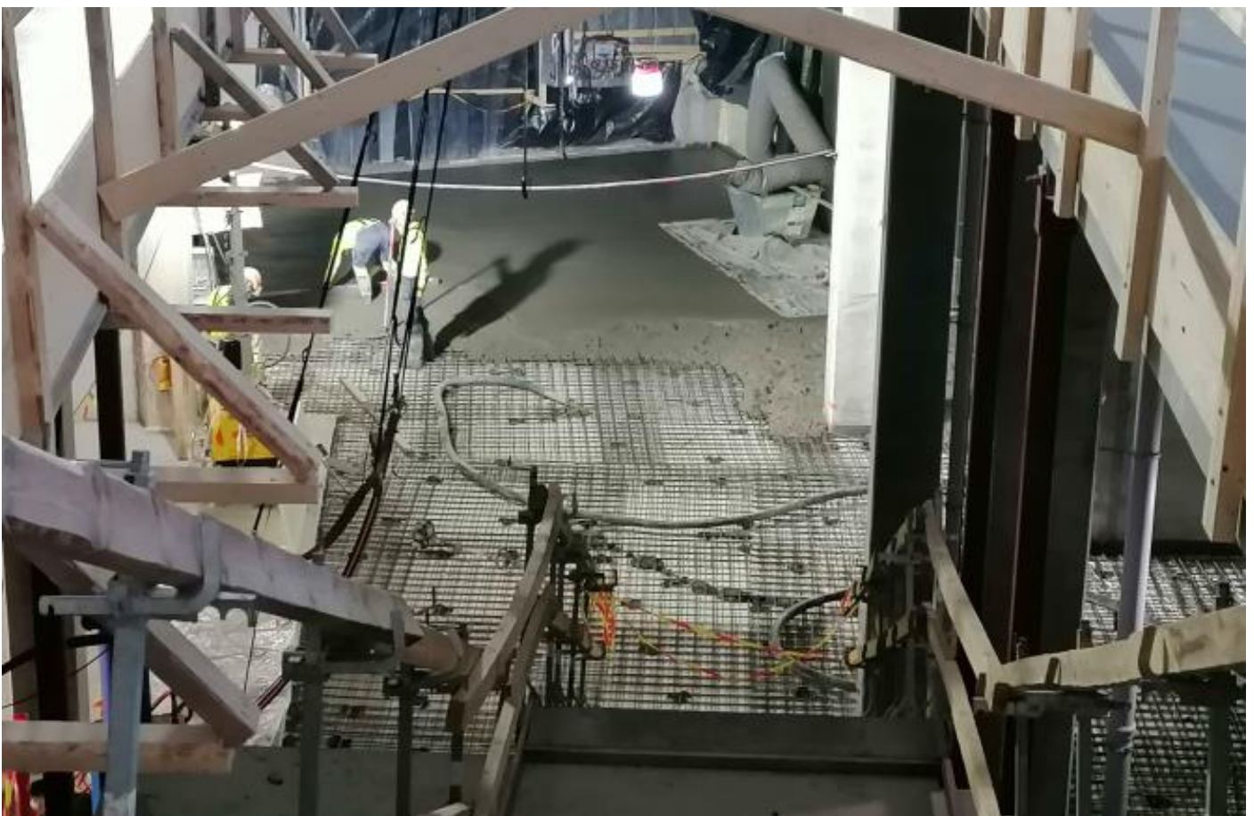
B2 – 1. krs lattiavalut käynnissä