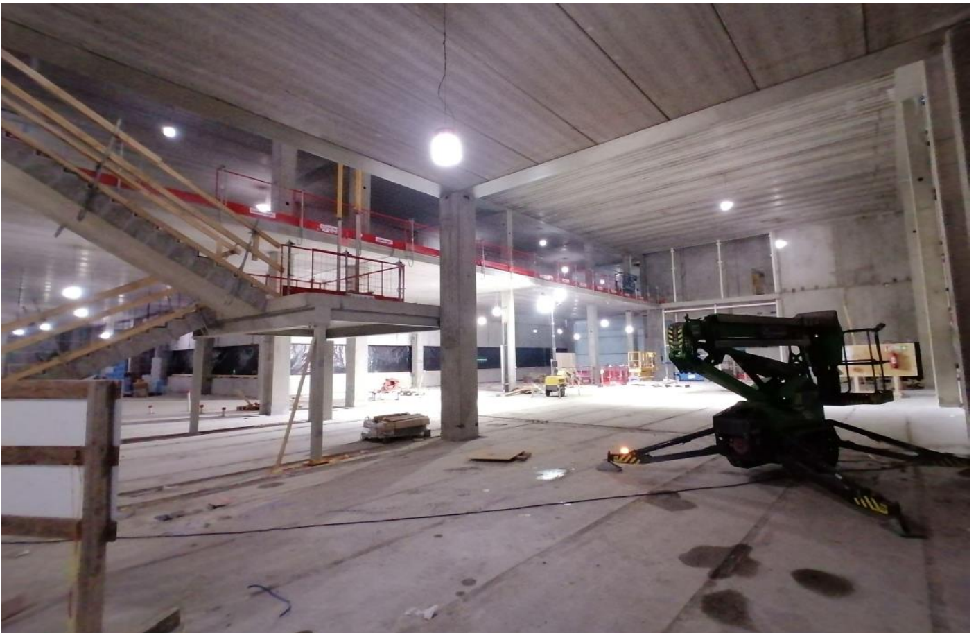
C1 - 2. ja 3. krs