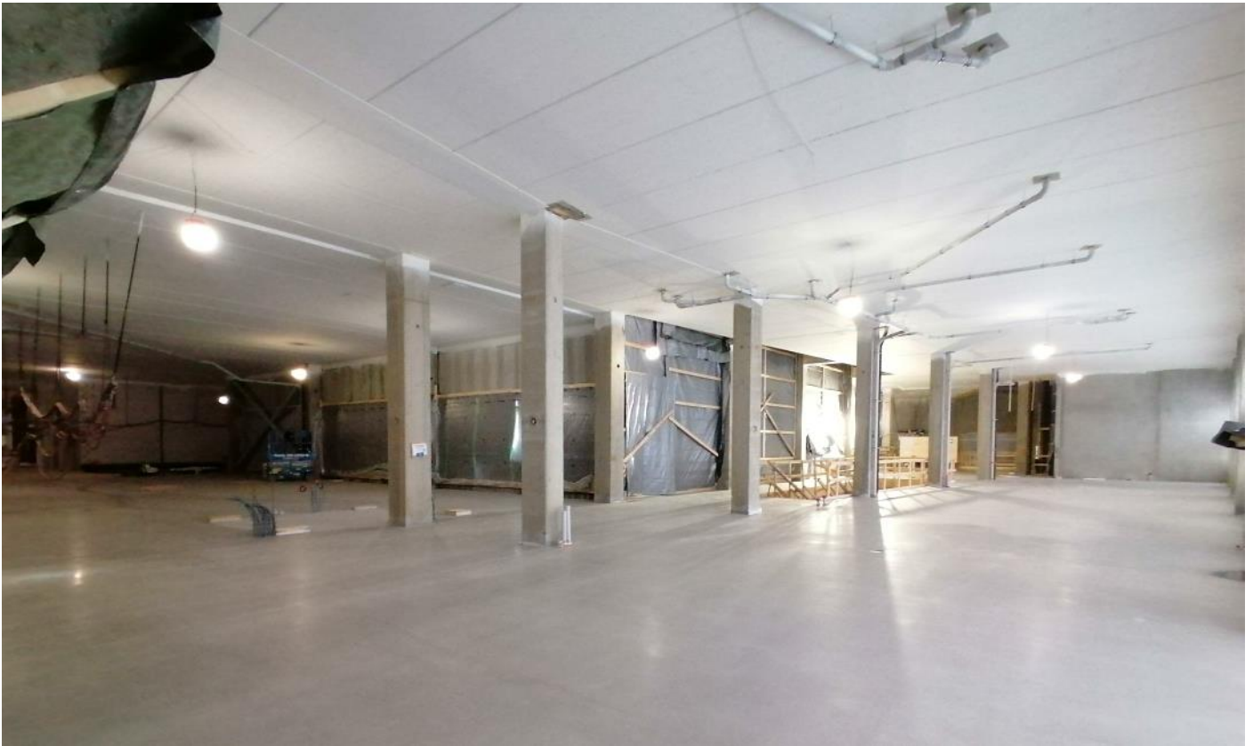
B2 – 2. krs