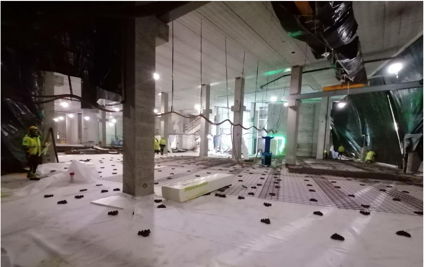
C1 - 1. krs