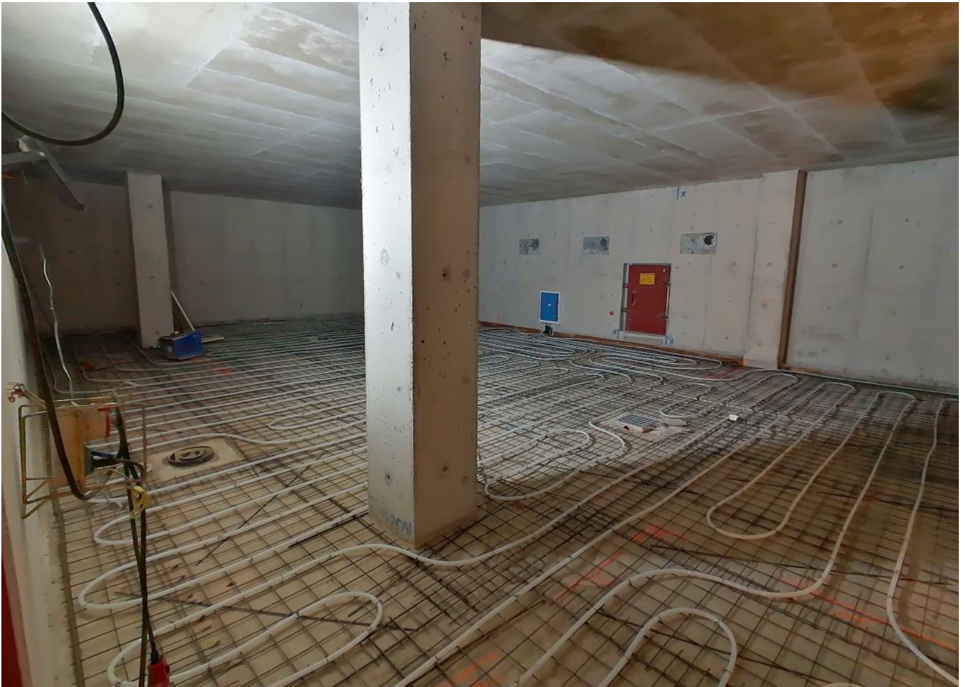
C – Pohja kerros, Väestönsuoja