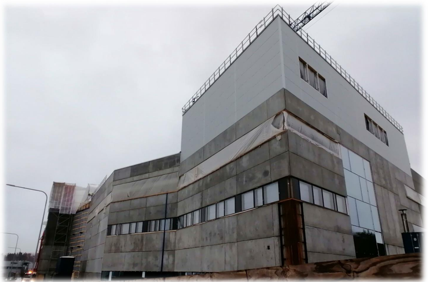
Pohjoinen pääty – julkisivun ikkuna-asennukset päässeet hyvin vauhtiin