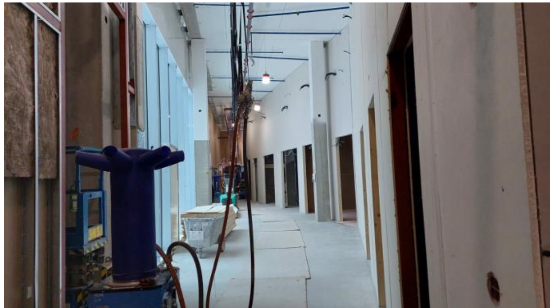
A-lohko, Muurattuja väliseiniä