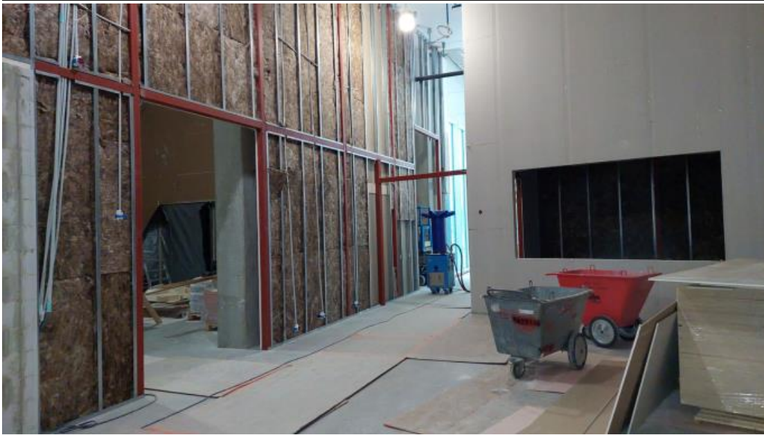
A-lohko, Levyväliseinä asennukset