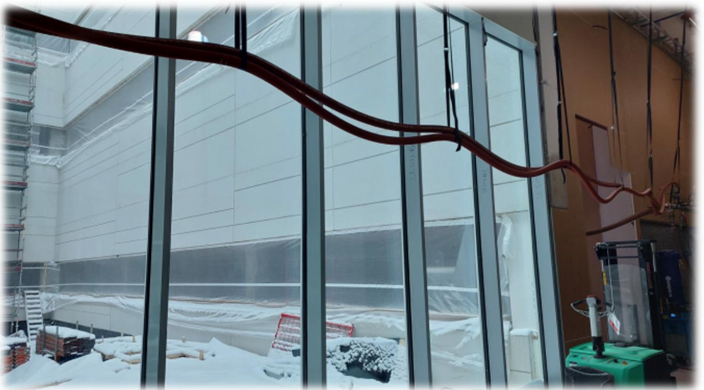
A-lohko 1.krs, Lasiseinä asennettuna (sisäpihalle)