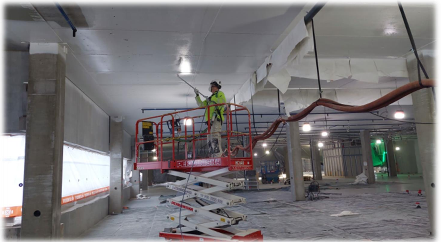
A-lohko 3. krs, Pölynsidonta maalausta