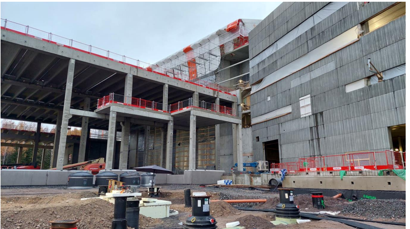
B- ja C-lohko, lastauslaituri