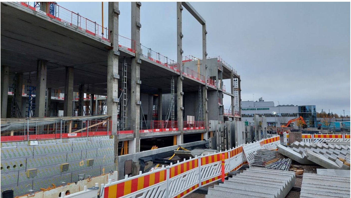
C-lohko, Eteläinen julkisivu