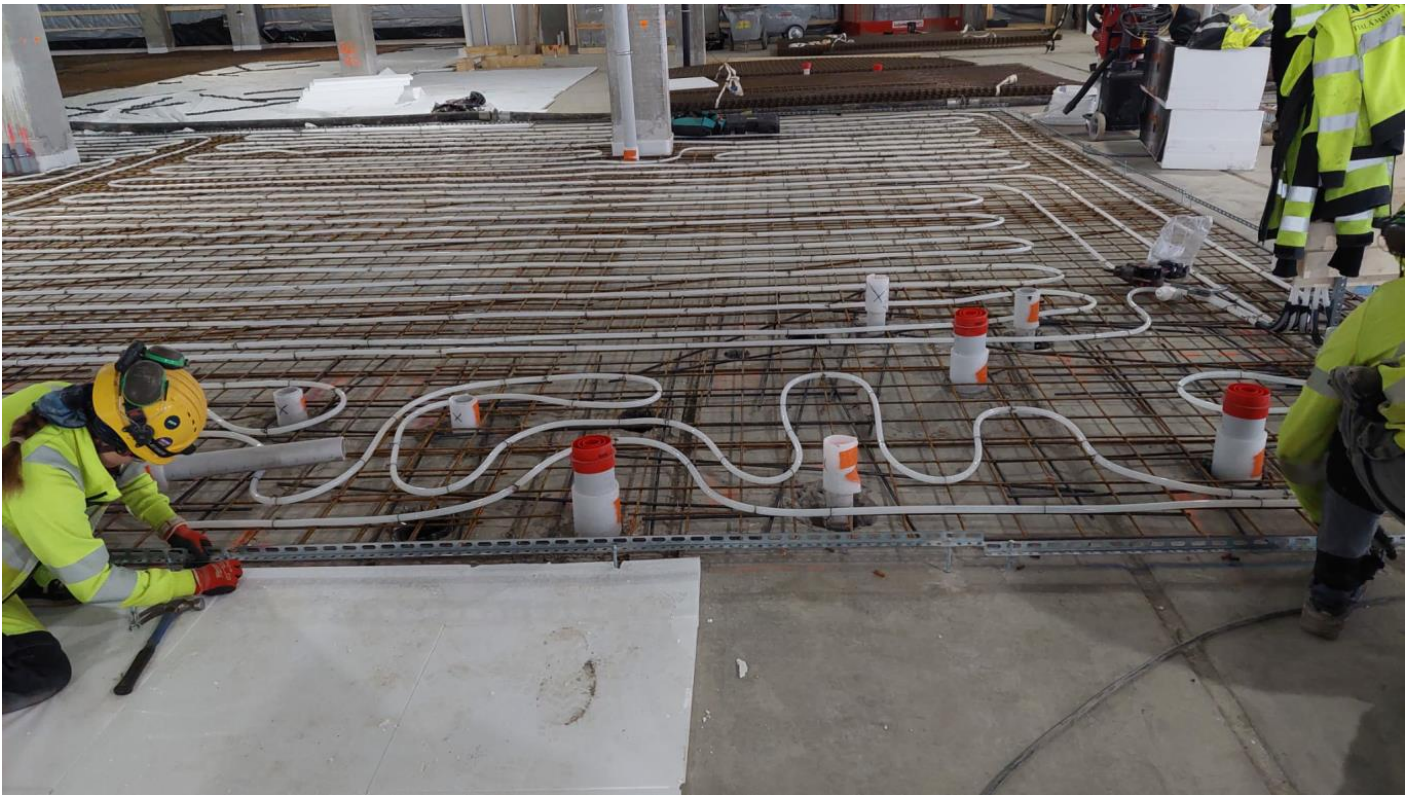
Lattialämmityksen asennuksia A-lohkon 2. kerroksessa