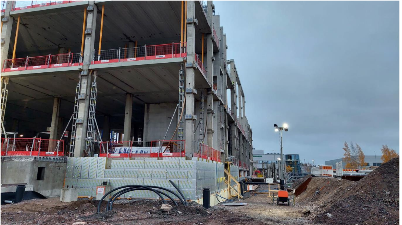
C-lohko, eteläinen sekä itäinen julkisivu