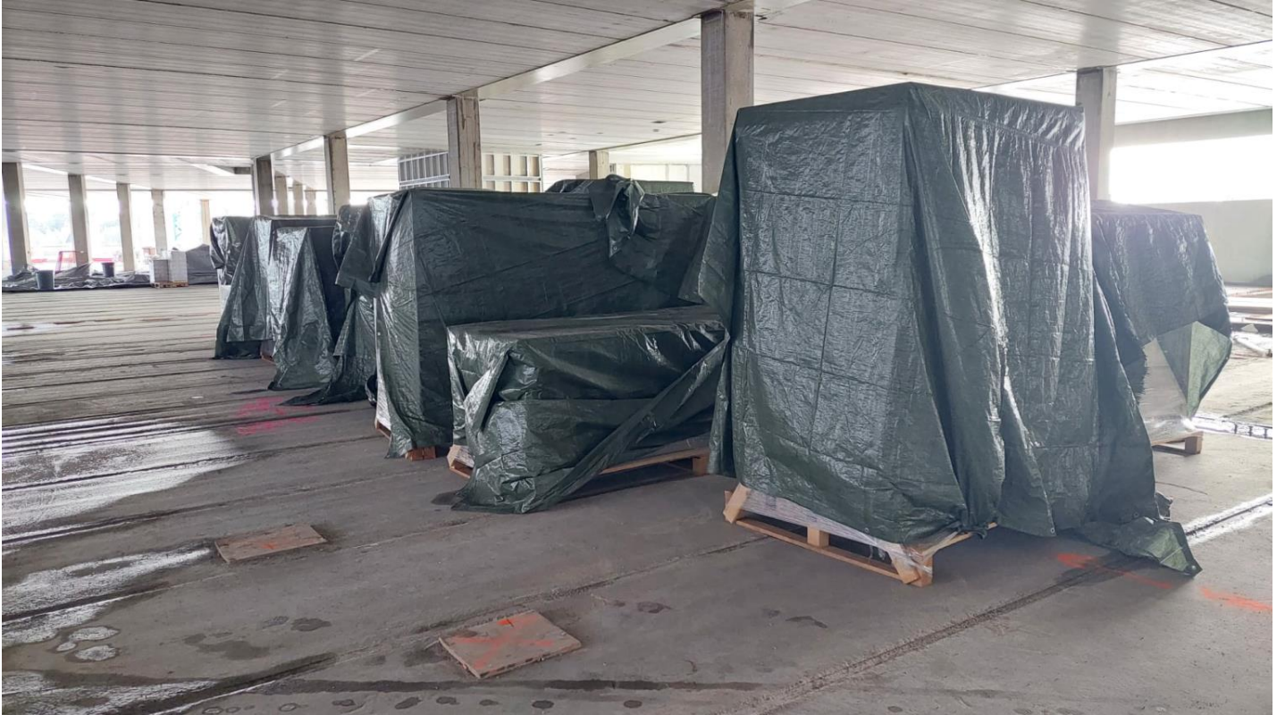
Materiaalit oikein varastoituina; Sääsuojuattuina, lavojen päällä