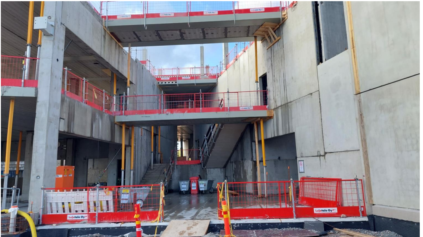
C-B -lohkojen välinen sisäänkäynti