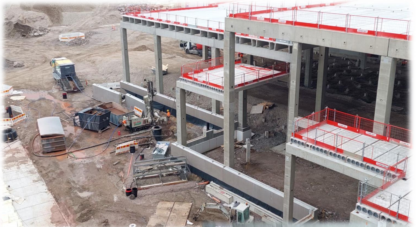
- Maalämpöporaukset käynnissä